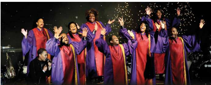
Le gospel, une expression artistique où le corps tient une place importante.

Résurrection : Action de se « réveiller, se mettre debout ». Pour les chrétiens, cela signifie être libéré de la mort. Ce n'est pas une réincarnation, ni un recommencement : c'est une vie nouvelle que Dieu donne à l'homme.