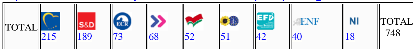
Tableau des orientations politiques de partis européens de gauche à droite